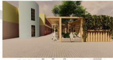
ŞBP BÖLÜMÜ YOL AKSI