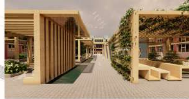
ANA YOL AKSI