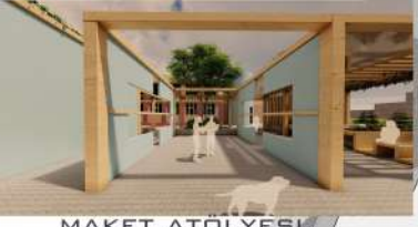
MAKET ATÖLYESİ ESNEK DUVARLAR