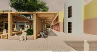
MİMARLIK BÖLÜMÜ YOL AKSI