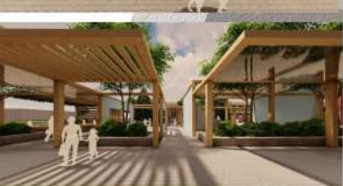
ARA YOL AKSI