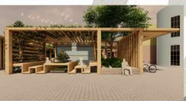
7/24 ÇALIŞMA BİRİMİ